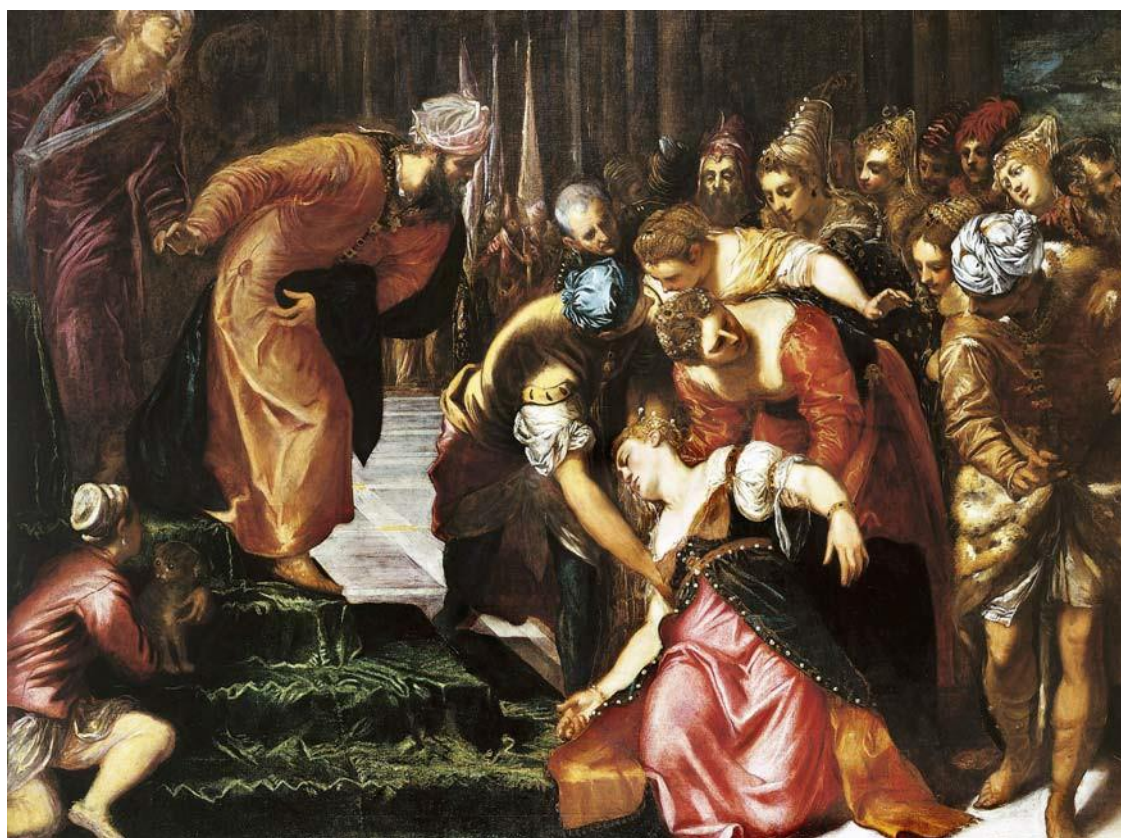
Il Tintoretto - Ester sviene al cospetto di Assuero - Pinacoteca Civica - Cuneo -