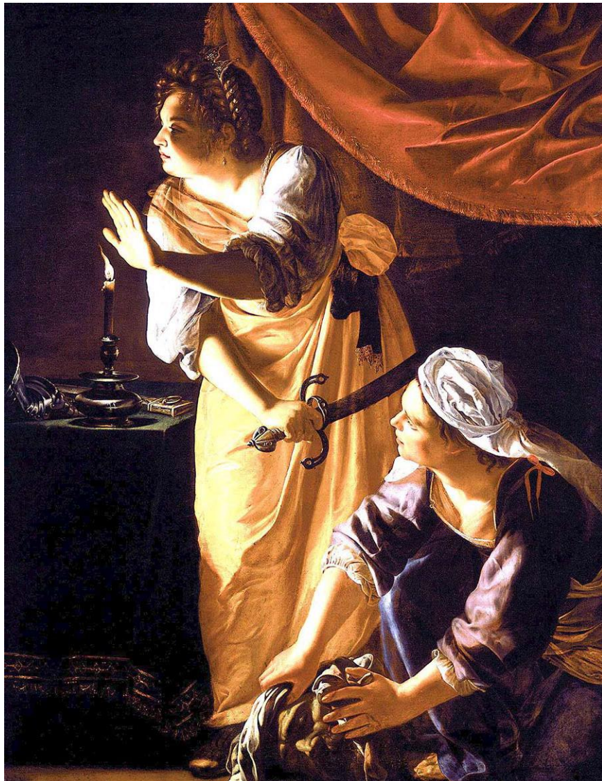
Giuditta e la sua serva - Artemisia Gentileschi - 1623-1625