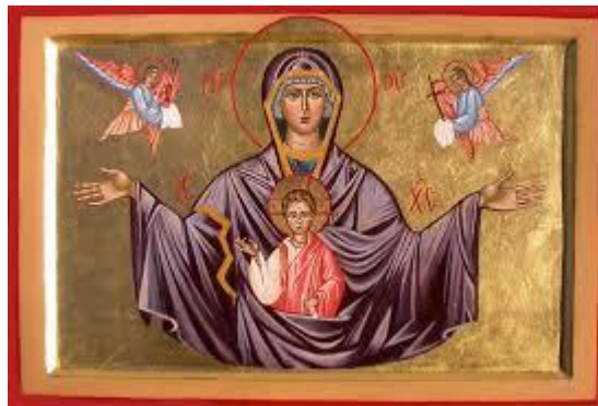
THEOTHOCOS: Dei genetrix, dogma ad Efeso 431.