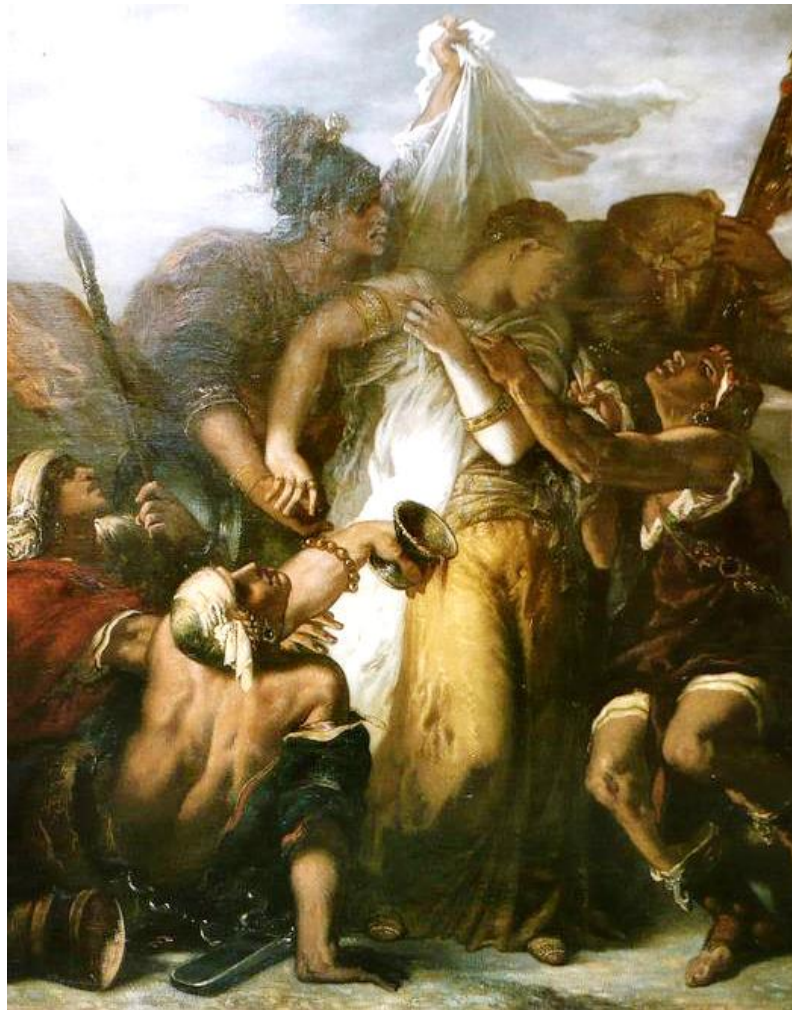
Ghustave-Moreau - Cantico dei Cantici - acquarello