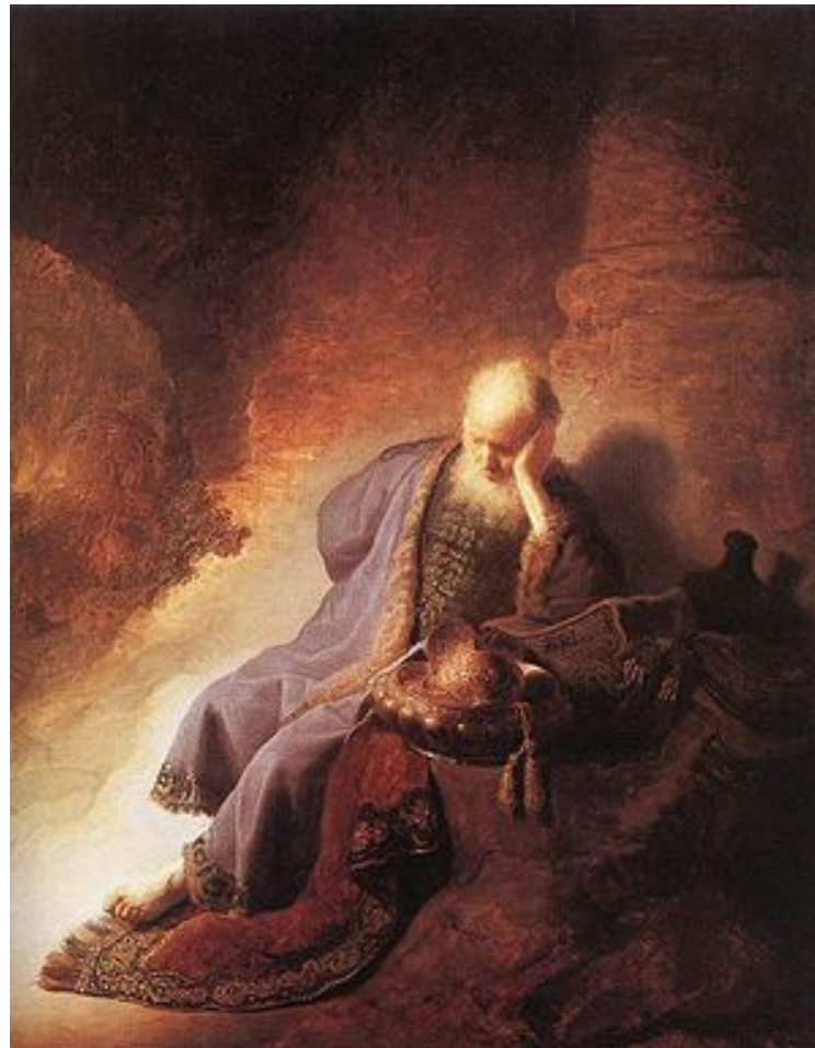
Rembrandt - Geremia lamenta la distruzione di Gerusalemme - Rijksmuseum di Amsterdam.