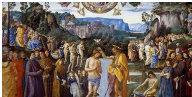
Vide squarciarsi i cieli e lo spirito discendere verso di lui come una colomba (Mc 1,10)