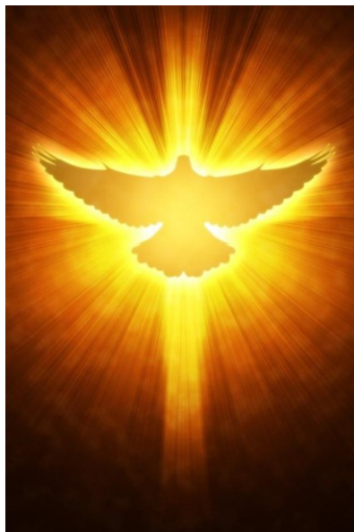
Spirito Santo: fuoco della Verità 19 La colomba e la croce nel fuoco dello Spirito divino