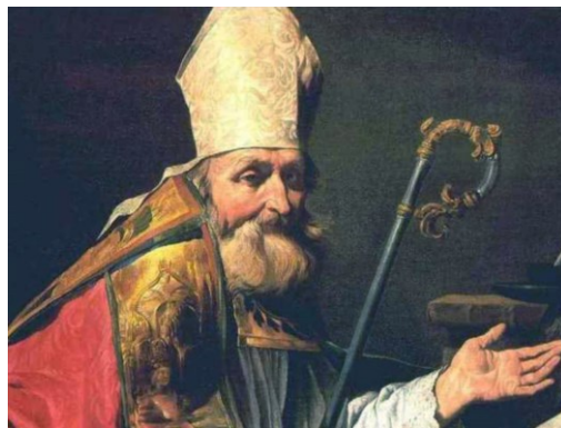
Ambrogio divenne vescovo di Milano nel 374

« La parola di Dio è viva, efficace e più tagliente di ogni spada a doppio taglio » (Eb 4,12). Gesù è un Messia di pace che annuncia un messaggio di pace, ma conosce anche la durezza del cuore umano e sa che non tutti sono disposti ad accoglierlo. Così la parola del Vangelo è un messaggio che divide: una quotidianità senza incertezze, senza alcun turbamento, senza imprevisti o difficoltà, non è la quotidianità di chi è discepolo di Gesù.