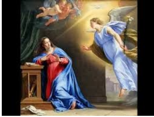
L'angelo porta l'annuncio; in alto lo Spirito Santo si dirige sulla Vergine turbata

Il suo andare da Elisabetta non è un voler comprovare la verità di quello che l'Angelo le ha detto, perché lei non ha chiesto un segno, come invece aveva fatto Zaccaria.