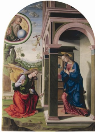
Annunciazione di Raffaello

Riflettiamo sull'evento dell'incontro delle due madri e ricordiamo la storia di Israele. Noi sappiamo che Maria è l'Arca dell'Alleanza, il segno della presenza di Dio in mezzo al suo popolo.