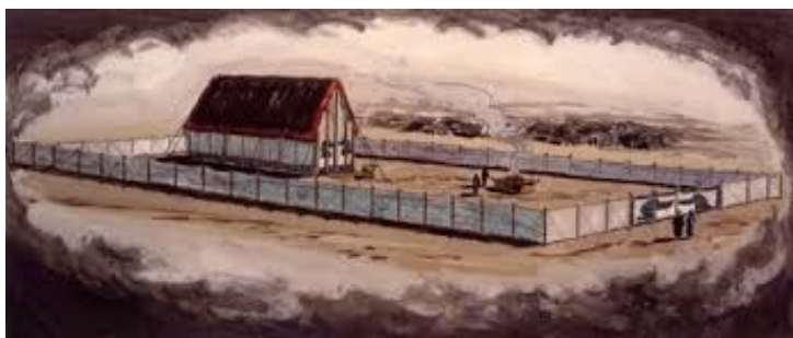
Nube e tabernacolo

Nell’Antico Testamento (Es 40,35), quando la nube aveva coperto con la sua ombra il tabernacolo, la gloria del Signore, cioè la presenza di Dio, aveva riempito la dimora.