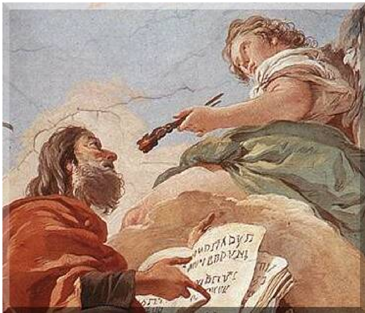
Giambattista Tiepolo - ISAIA e l'angelo col carbone ardente