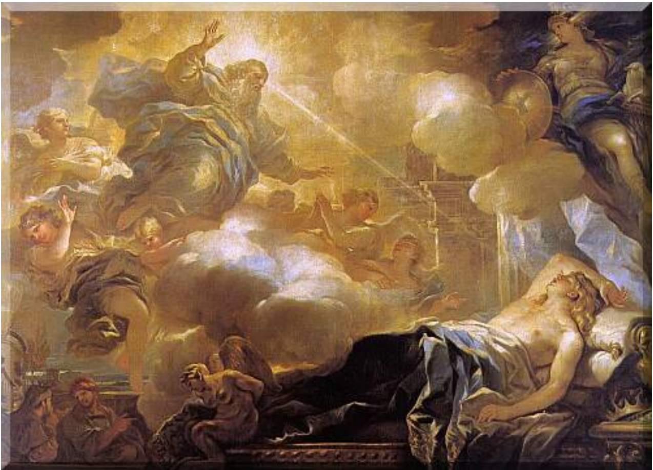
Luca Giordano : Il sogno di Salomone - Museo del Prado, Madrid