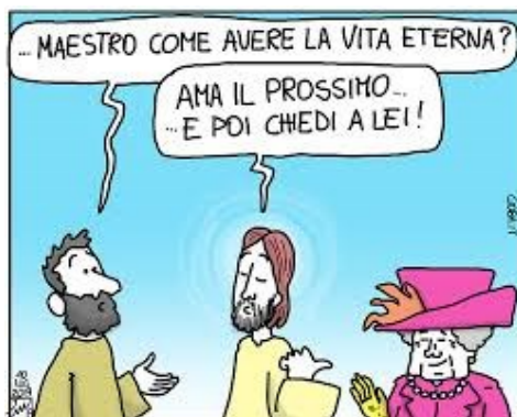
Vignetta di Don Gioba (il terzo personaggio è satirico?)

preghiera insistente e perseverante della vedova.