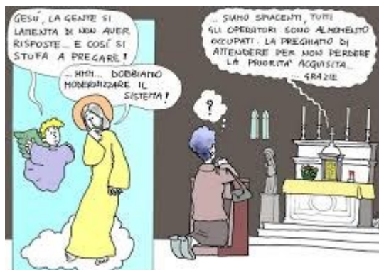
Come possiamo utilizzare questa vignetta?

“Diceva loro una parabola sulla necessità di pregare sempre, senza stancarsi mai”. L'insegnamento di Gesù vuole evidenziare quanto sia importante ed efficace pregare. La preghiera è una forza così potente che è in grado di smuovere persino un giudice, che non temeva Dio né aveva riguardo per alcuno.